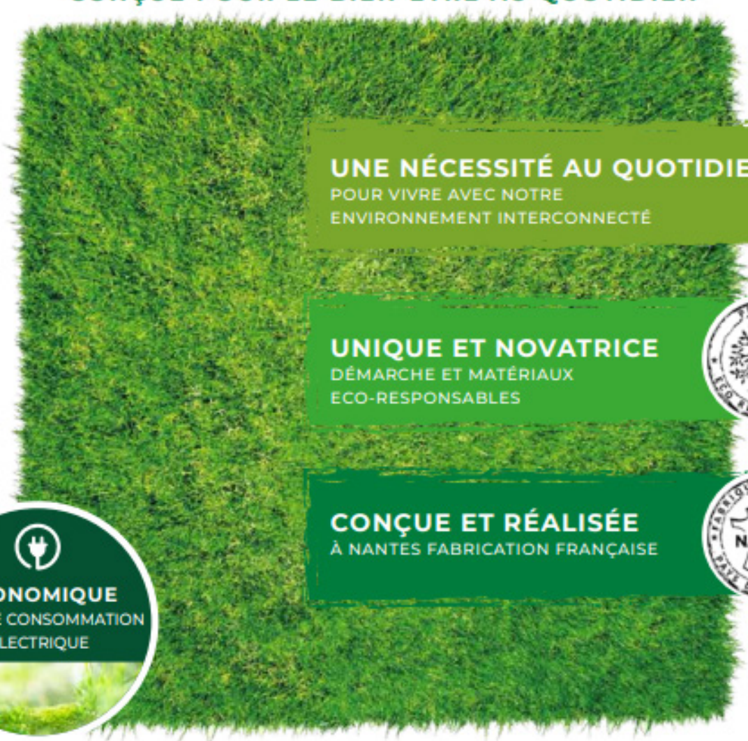
PLANCHE DE MISE À LA TERRE DU CORPS HUMAIN CONÇUE POUR LE BIEN-ÊTRE AU QUOTIDIEN